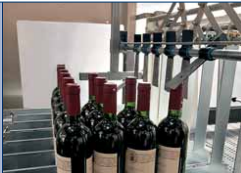
Separatore multifornato con controllo presenza bottiglie Multifornat separator with checking device of bottles presence Separateur multifornat avec control de présence bouteilles