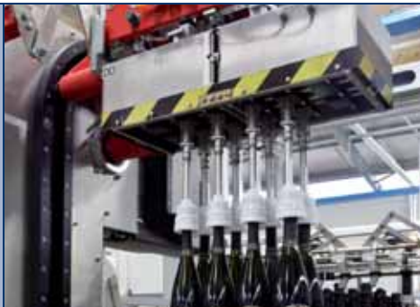
Movimento meccanico radiale comandato da inverter Radial mechanical movement controlled by inverter Mouvement radial mécanique contrôlé par convertisseur de fréquence