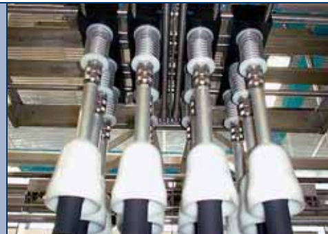
Testa di presa multifornato Multifornat pick-up head Tête de prise multifornat