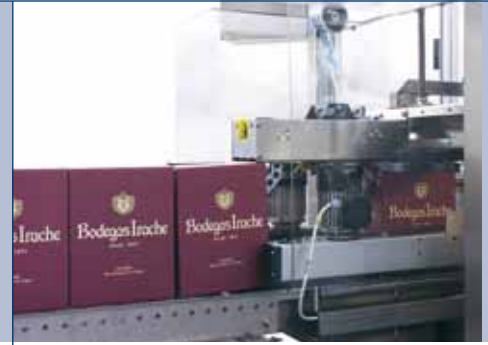
Unità di nastratura per chiusura delle falde superiori ed inferiori Taping unit for upper and lower flaps sealing Unité d'application de ruban pour la fermeture des rabats supérieurs et inférieurs