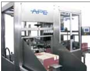
Magazzino cartoni con capacità fino a 75 pz. Case magazine with a capacity up to 75 pieces Magasin cartons avec capacité jusqu'à 75 pièces