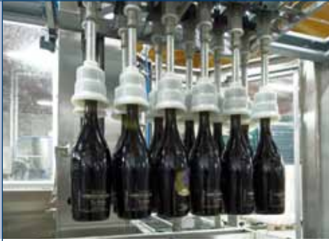
Testa di presa multiformato Multiformat pick-up head Tête de prise multiformat