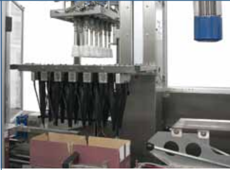
Imbuti centratori per cartoni con alveari preinseriti Centering funnels for cases with preglued partitions Entonnoirs de centrage pour cartons avec croisillons préexistants